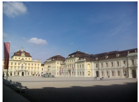
Das Barockschloss

Ein Besuch ist mithin sehr aufschlussreich und zu empfehlen.